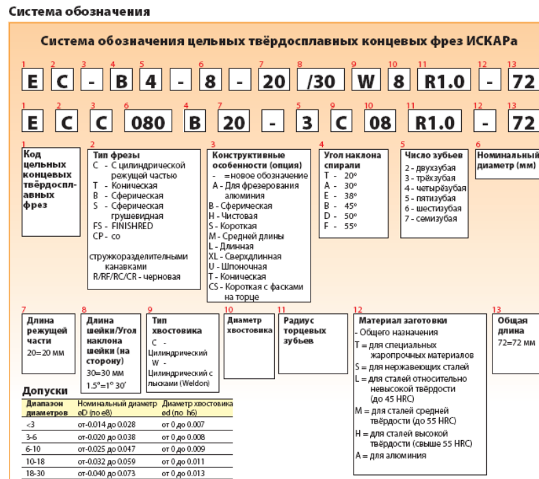
Рис. 1 – Система обозначения цельных твердосплавных концевых фрез ИСКАРА

Например, в Iskar система обозначения цельных твердосплавных концевых фрез выглядит следующим образом: на первом месте указывается код цельной концевой твердосплавной фрезы, на втором тип фрезы (с цилиндрической режущей частью, коническая, сферическая), на третьем конструктивные особенности (сферическая, чистовая, короткая, длинная, шпоночная), на четвертом угол наклона спирали, на пятом число зубьев (двухзубая, трехзубая, четырехзубая), на шестом номинальный диаметр, на седьмом длина режущей части, на восьмом длина шейки, на девятом тип хвостовика (цилиндрический, конический), далее следуют диаметр хвостовика, радиус торцевых зубьев, материал заготовки и общая длина.