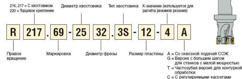
Рис. 3 – Система обозначения цельных концевых фрез в Seko

Необходимо иметь в виду, что обозначения для различных систем фрез могут различаться.